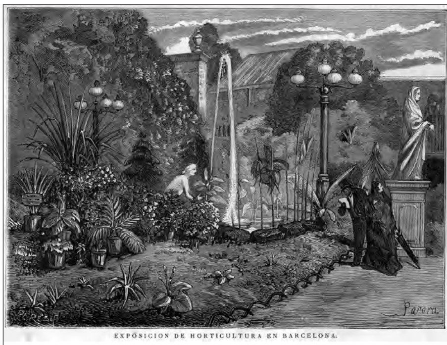
FIGURA 1. Exposició de floricultura organitzada pel Foment de la Producció Nacional i la Societat La Florestal amb motiu de les festes de la Mercè de 1877