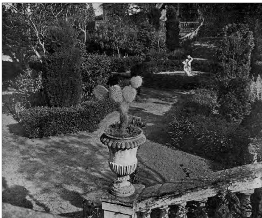
FIGURA 3. Detall dels jardins de Can Glòria, el 1933. La finca, d'estil neo-clàssic, estava ubicada a Horta i va desaparèixer el 1992 amb la construcció de la Ronda de Dalt