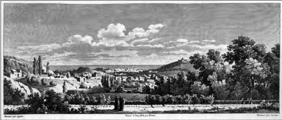
FIGURA 4. Vista de Barcelona des del jardí dels Caputxins, situat a l'anomenat «desert de Sarrià». Aquest jardí va ser un dels més importants de Barcelona ja des del segle XVI, i va desaparèixer amb la desamortització de 1835. Gravats d'Alexandre de Laborde «Voyage pittoresque et historique de l'Espagne» (1806)